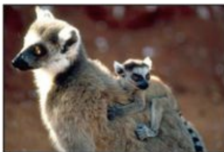
Lemures con cola en anillos, Lemur catta, nativos de Madagascar.

oceánicas se dirigen hacia Africa y alejándose de Madagascar. Sin embargo, simulaciones en computadora indican que las corrientes durante el Eoceno fluían en una dirección diferente, siendo que Madagascar estaba en un lugar diferente. De acuerdo con las simulaciones, las corrientes oceánicas de Eoceno fluían desde Africa hacia Madagascar, por lo que hubiera sido posible el “rafting” trayendo animales terrestres hacia la isla. El rafting habría sido un factor importante en la dispersión sobre el agua cuando las corrientes oceánicas eran diferentes de lo que son hoy.