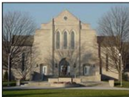
La Iglesia Pioneer Memorial en Andrews University.

Geoscience Newsletter es una publicación-e del Geoscience Research Institute (Instituto de Investigaciones en Geociencia), 11060 Campus Street, Loma Linda, CA 92350, USA. Para suscribirse, por favor envíe un email a: www.grisda.org/ ó geociencia@uapar.edu