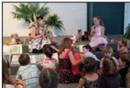
Niños participan de una celebración de Sábado de Creación en la iglesia ASD de Port Macquarie (Australia).

Animamos a las iglesias locales a que celebren “Sábados de Creación”. Vea: http://creationsabbath.net/ para más información y sugerencias. La iglesia ASD de Port Macquarie en Australia recientemente organizó una celebración de Sábado de Creación, y gentilmente nos envió una fotografía del evento.