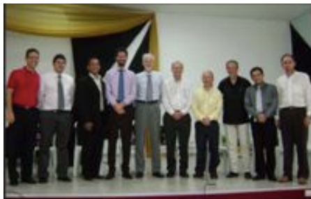
Los conferenciantes durante el Seminario de Creación celebrado en el IAENE, NE de Brasil.

Unas doscientas personas asistieron al seminario sobre creación y ciencia en el IAENE (actualmente Faculdades Adventistas da Bahía, en Cachocira), desde el 10-12 de noviembre 2010. Cinco científicos de los EE.UU y Sudamérica hicieron presentaciones sobre tópicos desde ballenas fósiles hasta paradigmas universales.