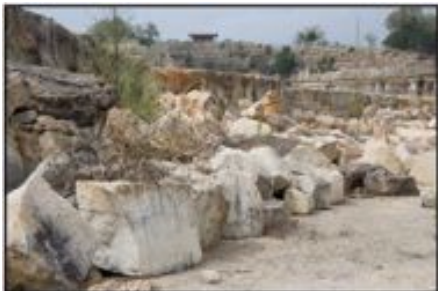
Una vista de la Canyon Gorge (Garganta del Cañón) con los bloques rotos y transportados por la inundación del 2002.

365 m de ancho justo por debajo del canal de desagüe, y rápidamente disminuye su ancho a como 50 m en el trayecto de un km. Este flujo erosionó la Glen Rose Formation, compuesta de caliza, a una profundidad media de 7,2m.