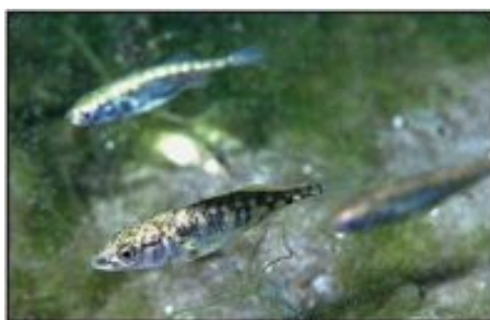
El pez espinoso de tres espinas, Gasterosteus aculeatus .

Comentario. La adaptación a cambios de temperatura es un ejemplo de microevolución. Tales cambios microevolutivos han sido observados ocurrir rápidamente en una variedad de ejemplos documentados.