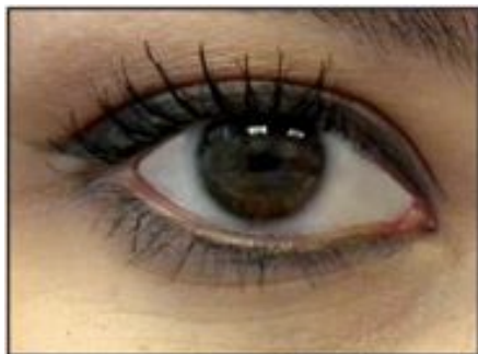
El ojo humano.

LALIN AM, RIBAK EN. 2010. Retinal glial cells enhance human vision acuity [Células de la glía de la retina aumentan la agudeza visual humana]. Physical Review Letters 104:158102.